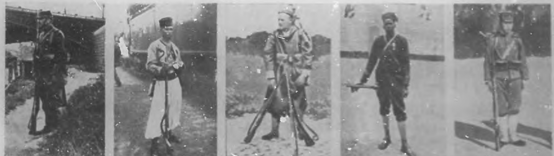
LA GUERRA EUROPEA.—Diferentes tipos del soldado de los aliados.—Infantería francesa.—Tirador argelino.—Tirador marroquí.—Tirador senegalés.—Infantería japonesa.

avergonzadas. Hay un modo de ludibrio de la razón, que tanto ha hecho por entronizarse al lado de la santa libertad.