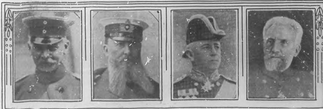
LA GUERRA EUROPEA.—El General Falkenhayn, Ministro de la guerra del imperio alemán.—El Almirante Alfredo Von Torpitz Ministro de la marina alemana.—El almirante Sir Giorgio Callaghan, comandante en jefe de la marina inglesa.—El Vice-almirante Boué de Lapeyrère, comandante en jefe de la flota francesa.