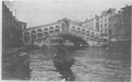
Venecia.—Ponte de Rialto.

—Es un palomar esta iglesia extravagante y abigarrada de San Marco. Muy cerca del Campanile reconstruido, se dicen las cosas de amor menos feos millares de palomas libres, hijas de aquellas que se refiere fueron tan generosas con el Dogo Enrique Dandolo cuando el asedio de Candia; las observo nerviosas porque pasa un dirigible y las asusta; se protegen bajo el pecho fiero del histórico León de Venecia y bajo los arcos borrosos de los Palazzos ducales.... Son grises, de tornasol, blancas y negras; llegan en bandadas y se posan en las manos purísimas de niñas venetas, inglesas y del mundo entero. Las campanas hacen aspavento en el palomar, y el sol que