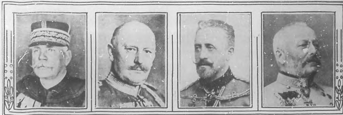
LA GUERRA EUROPEA.—Los principales jefes de los ejércitos en guerra: General Joffre, generalísimo del ejército francés.—General Helmuth von Moltke, jefe del Estado Mayor alemán.—El Gran Duque Nicolás, Comandante supremo del ejército ruso.—El Archiduque Federico, Comandante supremo de los ejércitos austro-ungaro.