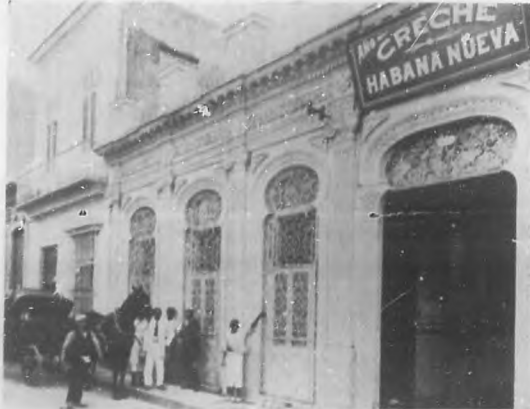
LA CRECHE HABANA NUEVA.—Vista exterior del edificio.

En todas partes se ha hablado de la inauguración de la "Creche Habana Nueva", la cual revistió excepcional carácter de suntuosidad y de espontáneo entusiasmo. Imposible nos sería dar una idea exacta de lo que esa fiesta fue, y del notable y brillante discurso que en ella pronunció el General Eusebio Hernández.