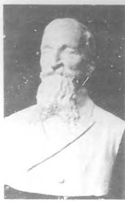
El Sr. M... que patriota Mar... de arte...