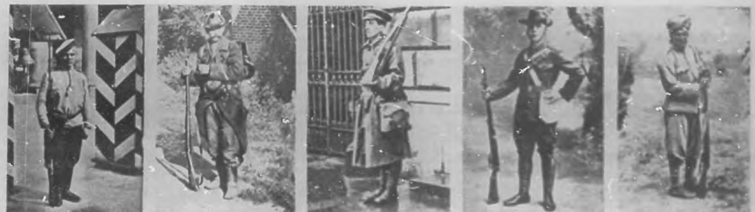
LA GUERRA EUROPEA.—Diferentes tipos de soldados de los ejércitos aliados.—Infantería ruso.—Infantería belga.—Infantería inglesa.—Voluntarios irlandeses.—Infantería india.

fensa de motivos, sigue invadiendo los corazones un tremendo torpor, una dura angustia sofoca cualquier ráfaga de esperanza. La desolación espiritual es tan terrible, que las ideas de civilización tiemblan