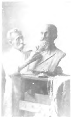
El Sr. M... del Conservatorio Nacional...