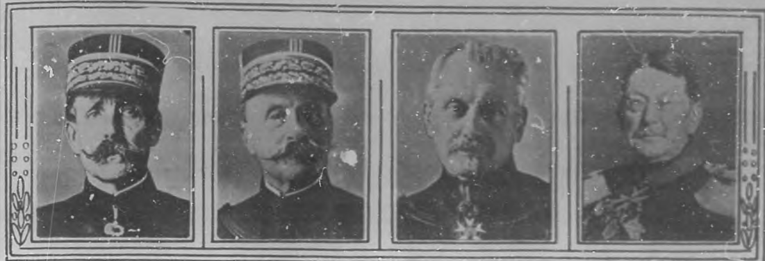
LA GUERRA EUROPEA.—Los Generales franceses Dubail, Foch y Maunoury.— El General alemán Von Goetz, nombrado Gobernador de Bélgica.

N O es de estas páginas hacer personal comentario sobre el actual momento en que los ejércitos se despedazan, en esta gran siega de vidas e intereses materiales. Tampoco