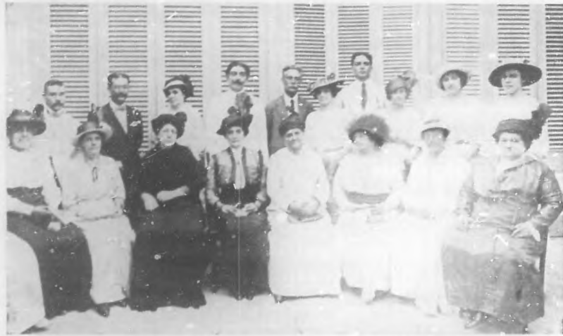
LA CRECHE HABANA NUEVA.—Señora Presidenta y Junta Directiva de la "Creche Habana Nueva".

ceras palabras de consuelo que alivien su intensa pena. Reciban en estas líneas nuestro sentido pesame.