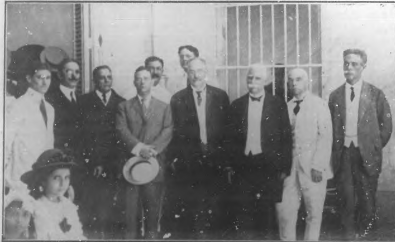
LA CRECHE HABANA NUEVA.—Distinguidas personalidades que asistieron a la inauguración.

Nos concretamos a publicar varias notas gráficas de esa obra noble y santa, de protección a los niños pobres.